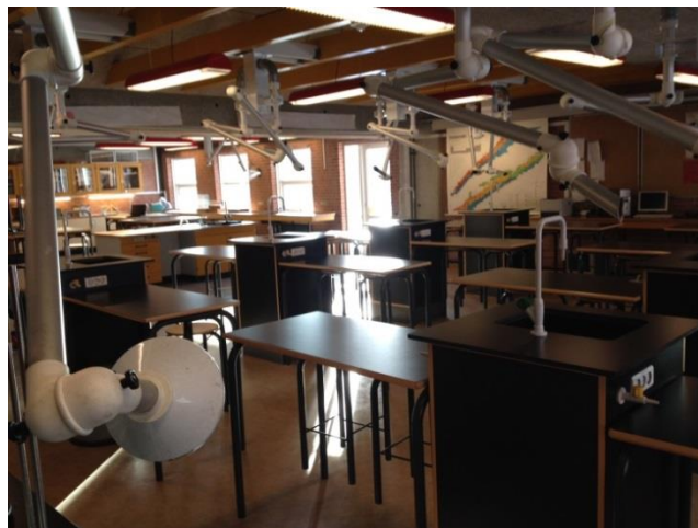
Fysik/kemi/biologi – et lokale som allerede er klar til den naturvidenskabelige fællesprøve