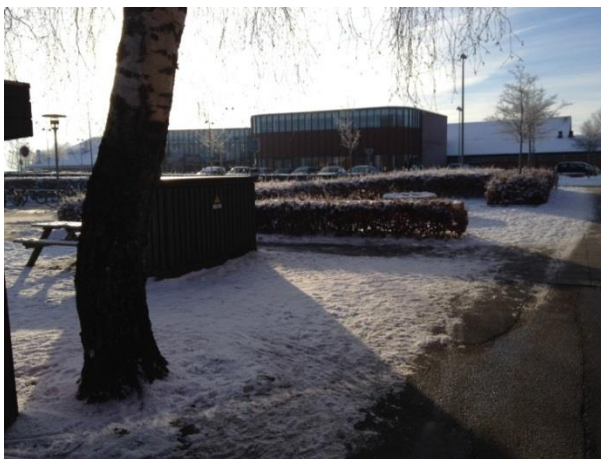
Direkte til Them Hallerne, hvor der er adgang til hal, multihal og svømmehal