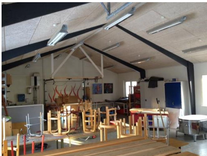
Opvarmet værksted med plads til alternativ kreativitet