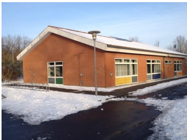
Musikhus som også benyttes af Den Kreative Skole